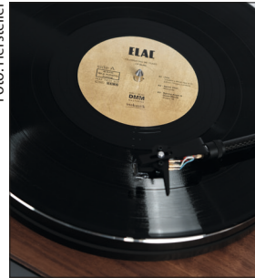
Elac Miracord 80