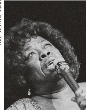
Sarah Vaughan S. 84