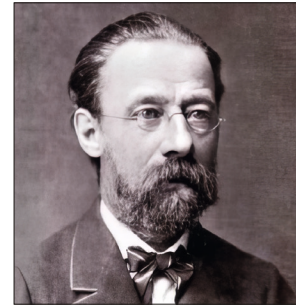
Smetanas Welt S. 72