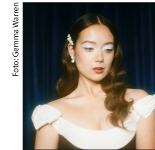
Laufey S. 84