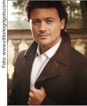
Vittorio Grigolo S. 30