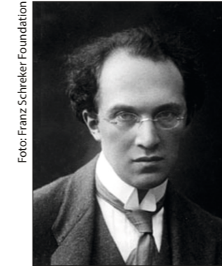
Franz Schreker S. 74