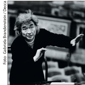
Seiji Ozawa S. 48