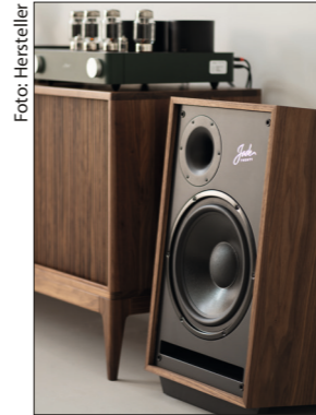
Pylon Audio Jade 20 S. 78